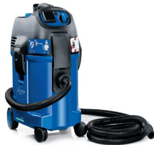
Typ S 530