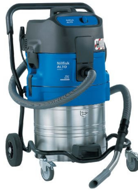
Typ S 560