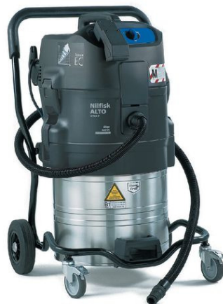
Typ S 960